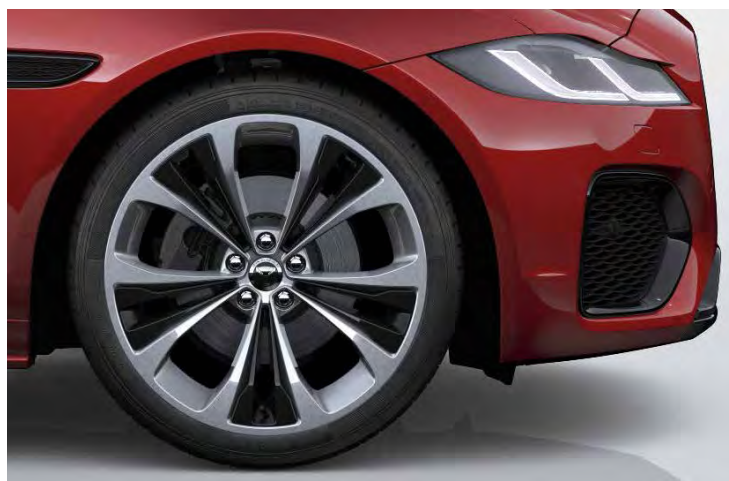
20" 'STYLE 5107' GLOSS SPARKLE SILVER MET ACCENTEN IN GLOSS BLACK