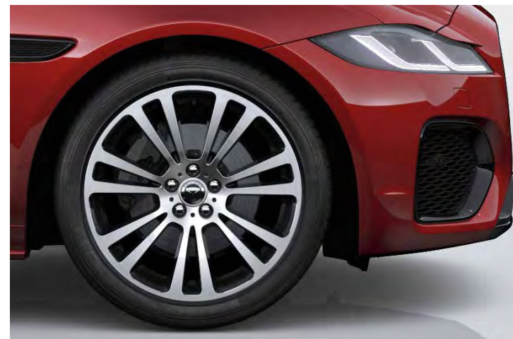
19" 'STYLE 7013' GLOSS BLACK & CONTRAST DIAMOND TURNED FINISH Standaard op XF R-DYNAMIC SE