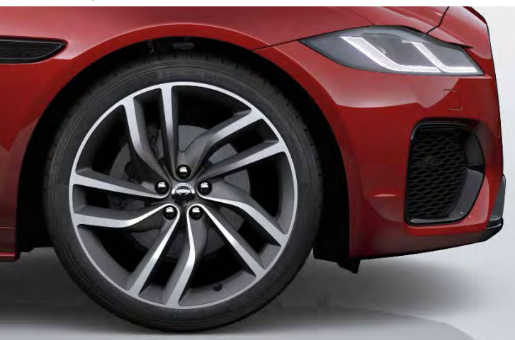
20" 'STYLE 5036' GLOSS DARK GREY & CONTRAST DIAMOND TURNED FINISH Standaard op XF R-DYNAMIC HSE