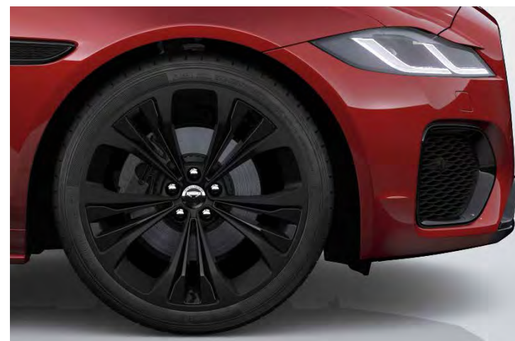
20" 'STYLE 5107' SATIN BLACK MET ACCENTEN IN GLOSS BLACK