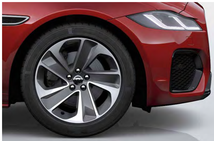
18" 'STYLE 5105' DARK GREY & CONTRAST DIAMOND TURNED FINISH Standaard op XF R-DYNAMIC S

Er is keuze uit een uitgebreid programma lichtmetalen velgen. De maten variëren van 18" tot 20". De markante designkenmerken voegen stuk voor stuk hun specifieke karakter toe aan de uitstraling van de auto. In de configurator op jaguar.be kunt u zien welke velgen beschikbaar zijn voor uw gewenste uitvoering.