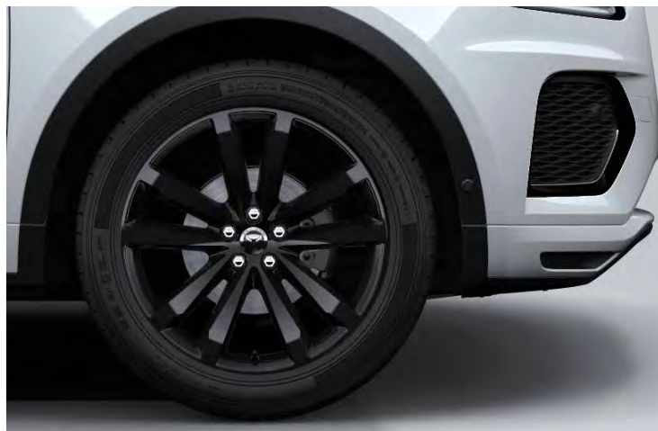
20" 'STYLE 5051' GLOSS BLACK