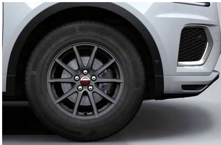
17" 'STYLE 1005' SATIN DARK GREY

Er is keuze uit een uitgebreid programma lichtmetalen velgen. De maten variëren van 17" tot 21". De markante designkenmerken voegen stuk voor stuk hun specifieke karakter toe aan de uitstraling van de auto. In de configurator op jaguar.be kunt u zien welke velgen beschikbaar zijn voor uw gewenste uitvoering.