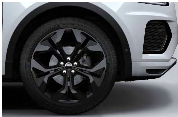
21" 'STYLE 5053' GLOSS BLACK