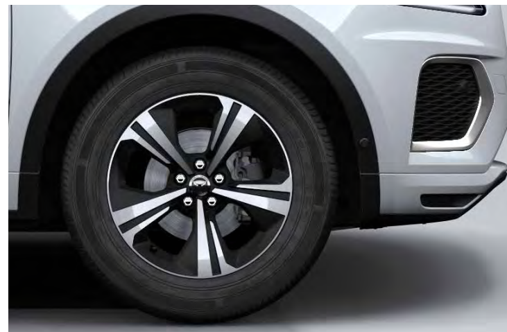
18" 'STYLE 5118' SATIN BLACK & CONTRAST DIAMOND TURNED FINISH Standaard op E-PACE R-Dynamic S