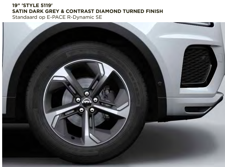
19" 'STYLE 5119' SATIN DARK GREY & CONTRAST DIAMOND TURNED FINISH Standaard op E-PACE R-Dynamic SE