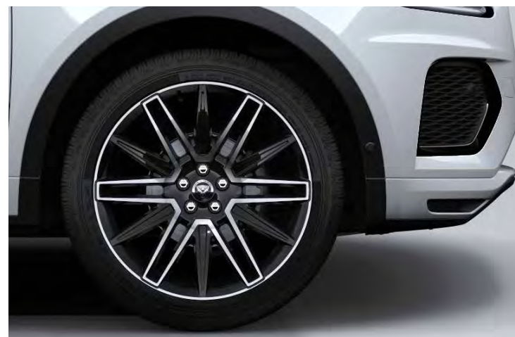
21" 'STYLE 1078' GLOSS BLACK & CONTRAST DIAMOND TURNED FINISH