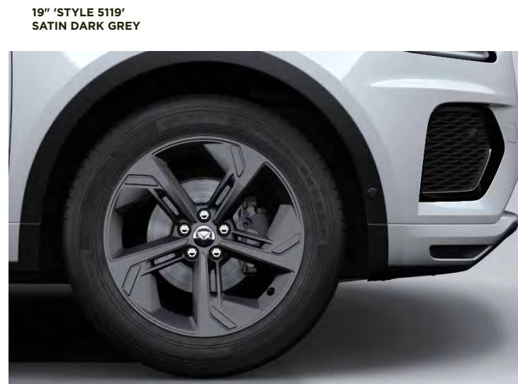
19" 'STYLE 5119' SATIN DARK GREY