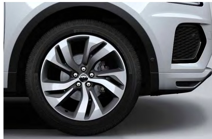
20" 'STYLE 5120' SATIN DARK GREY & CONTRAST DIAMOND TURNED FINISH Standaard op E-PACE R-Dynamic HSE